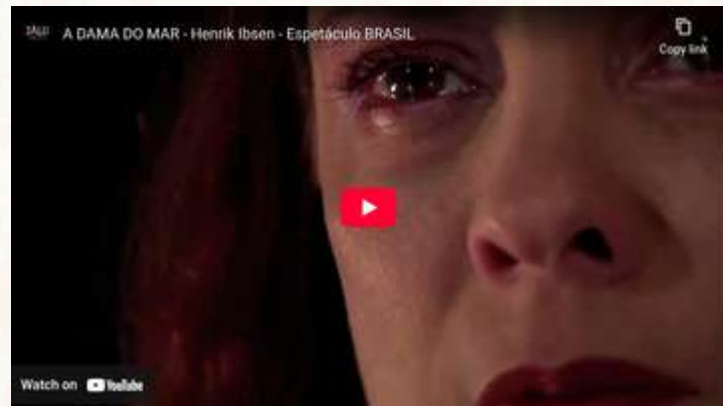
Espectáculo A Dama do Mar 2014/2016