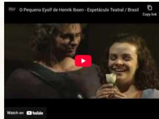
Espectáculo O Pequeno Eyolf 2003/2006