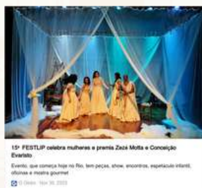
Espectáculo O Canto das Sereias 2024