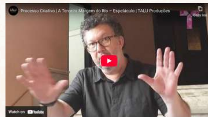
Processo Criação Trupe FESTLIP 2017