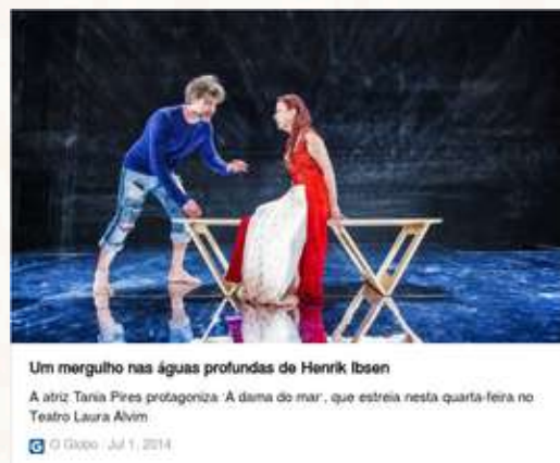
Espectáculo Dama do Mar 2014