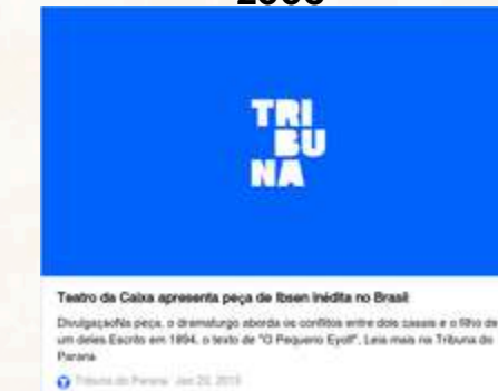
Espectáculo O Pequeno Eyof 2006