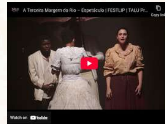
Espectáculo A Terceira Margem do Rio 2017/2023