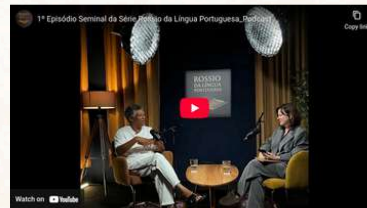
Série Podcast Rossio da Língua Portuguesa 2025