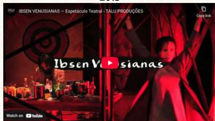
Espectáculo Ibsen Venusianas 2015