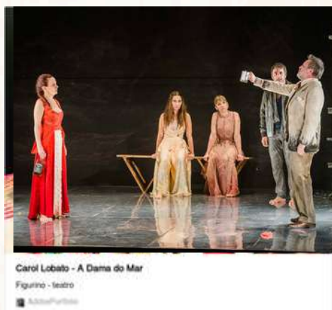
Espectáculo Dama do Mar 2014