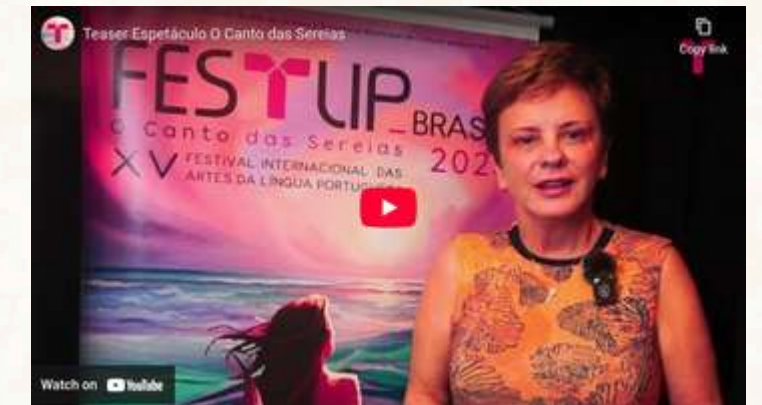
Espectáculo O Canto das Sereias 2024