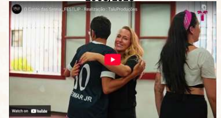
FESTLIP_Festival Internacional das Artes da Língua Portuguesa 2008/2026