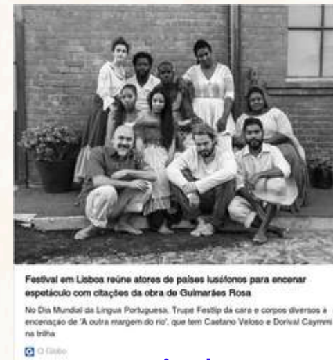
Espectáculo A Terceira Margem do Rior 2023